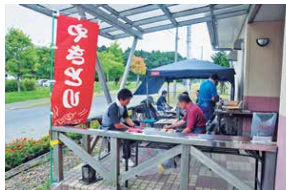
身障福祉会のやきとり