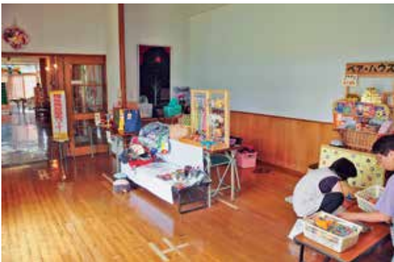
就労継続支援B型事業所ベアハウス