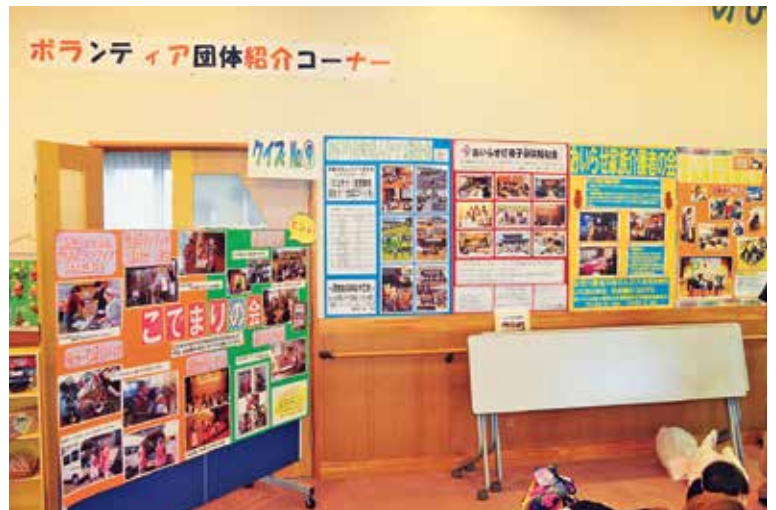
団体紹介コーナー