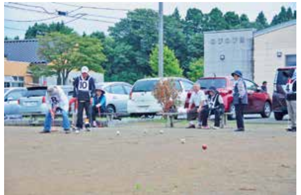
ゲートボール大会