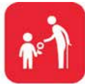
福祉・防災マップづくり ボランティアのための講座 子ども達と高齢者の交流