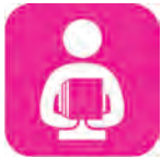
福祉情報を伝える