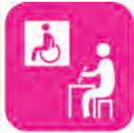
福祉教育・市民学習