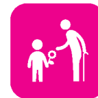
子ども達と高齢者の交流