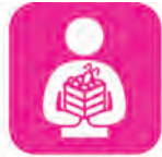
高齢者にあせら料理