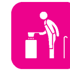
高齢者向け料理教室