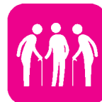
高齢者向けサロン