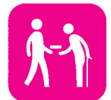
高齢者への配食サービス