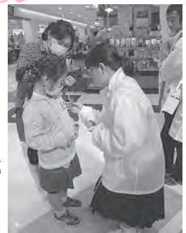
中学生による街頭募金活動(イオンモール下田にて)