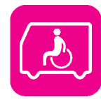
福祉施設に移動車両