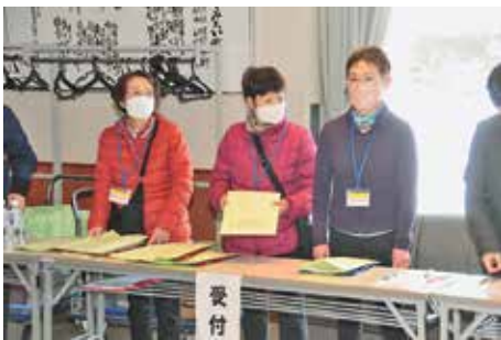
参加者がお手伝いしてくれました。