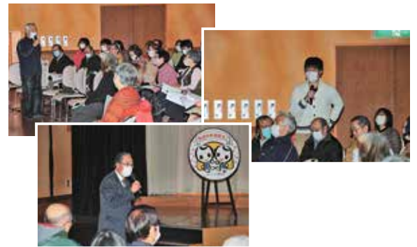
多くの意見や感想をいただきました。