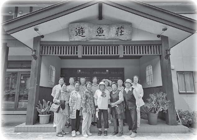
町母子寡婦福祉会日帰り研修旅行 (R5.7.14 十和田市焼山方面)