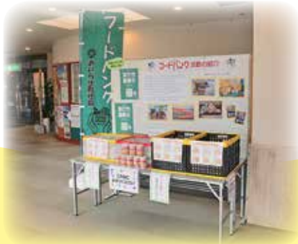
併催コーナー（フードバンク・e-sports park・町災害ボラ連）