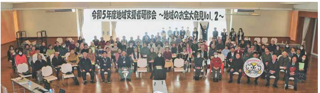
最後に、参加者約100名と関係者全員で記念撮影