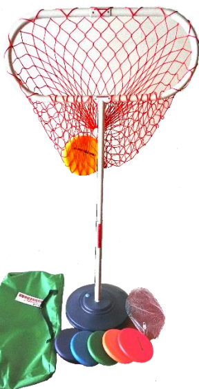
⑦ オーバルキャッチ