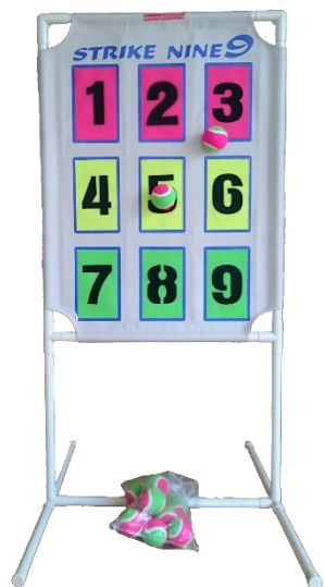
③ ストライクナイン