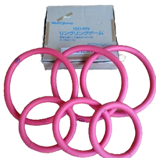
⑤ リングリングゲーム