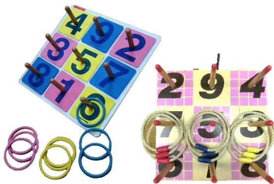
② 輪投げ (2種類)