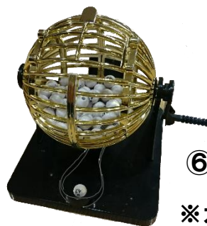
⑥ ビンゴ抽選機 (小型)