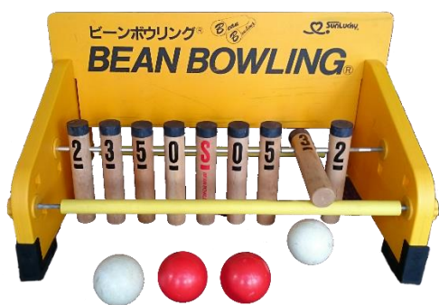
① ビーンボウリング