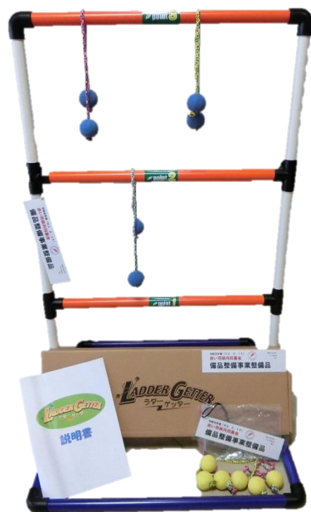
⑩ ラダーゲッター (新)